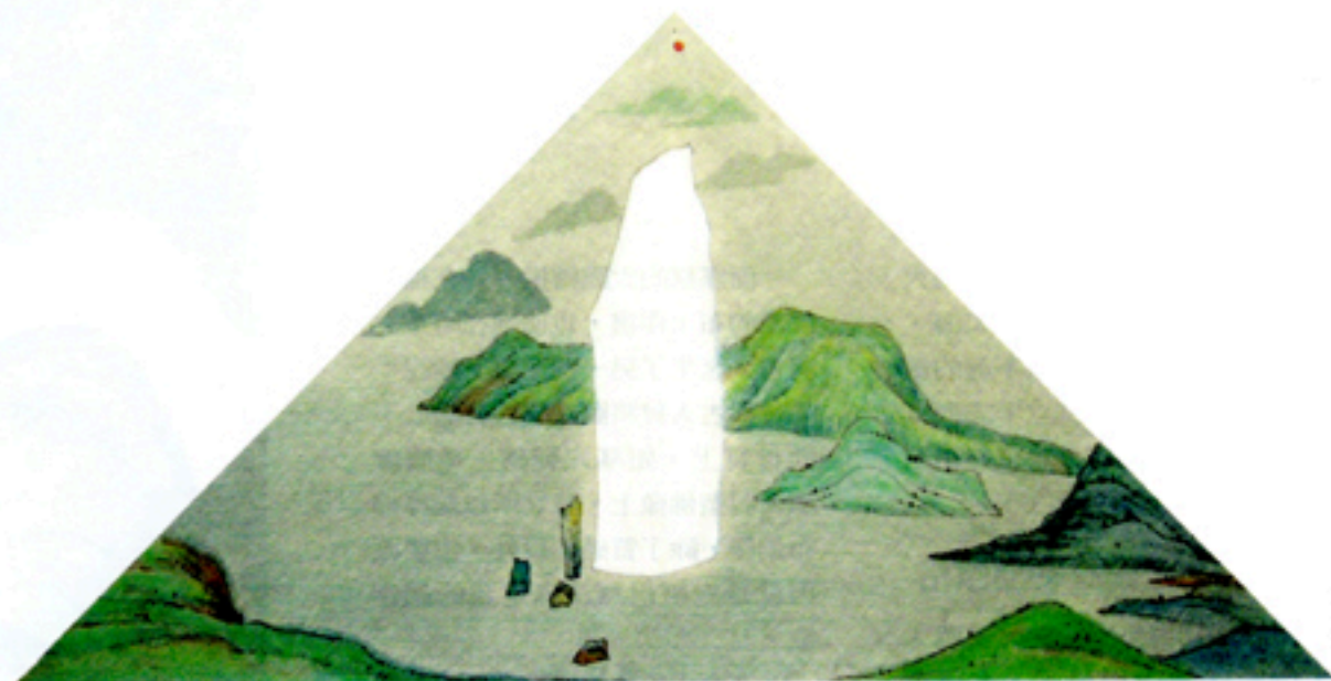
單純之必要 / 65cm X 133cm / 彩墨 / 棉麻布 / 2003年