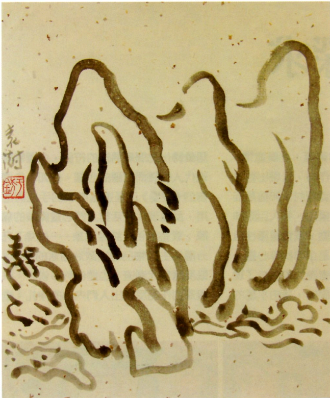
袁澍《游心3》·宣紙、水墨·34x27cm·2005。(袁澍提供)